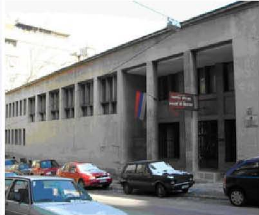
Galerija fresaka na mestu nekadašnje sinagoge 2012

Okončanjem Prvog svetskog rata nestalo je i vekovnog limesa na Savi i Dunavu. Beograd je postao primamljivo odredište za Aškenazi Jevreje koji su se počeli doseljavati iz nekadašnje Austro-Ugarske. U Beogradu ih je bilo i ranije. Mahom su dolazili kao zanatlije. Za razliku od Sefarda nisu ostajali okupljeni samo u jednom delu grada, tako da ih je bilo po čitavoj varoši. Verovatno i zbog takvog nastanjivanja, izabrali su za lokaciju svoje sinagoge sam centar grada, Kosmajsku ulicu 51 (Maršala Birjuzova). Prva sinagoga koja je zapravo bila zgrada u kojoj je bilo smešteno prvobitno Narodno pozorište (do 1869), ostala je Aškenazi sinagoga sve do izgradnje nove (1925, Lebl 1997). Pošto je obezbedila sredstva, Aškenazi opština je na adresi Kosmajске 19 odlučila da podigne novu sinagogu (1924). Prilikom početka radova kralj Aleksandar i kraljica Marija potpisali su povelju koja je ostala u temeljima sinagoge ( www.jobegrad.org ). Sinagoga je svečano otvorena naredne godine (1926) i ostala je najveća sinagoga koju je Beograd ikad imao. U toku Drugog svetskog rata nemački vojnici su hram u Kosmajskoj 19 koristili kao bordel (Lebl 1997). Aškenazi sinagoga Sukat Šalom je, za razliku od sefardskih, jedina ostala da služi svojoj nameni i nakon Drugog svetskog rata. Ostale beogradske i zemunske sinagoge više se nisu koristile u sakralne svrhe.