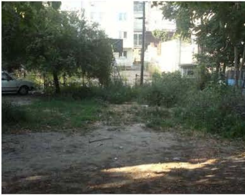
El kal Vjež 2012