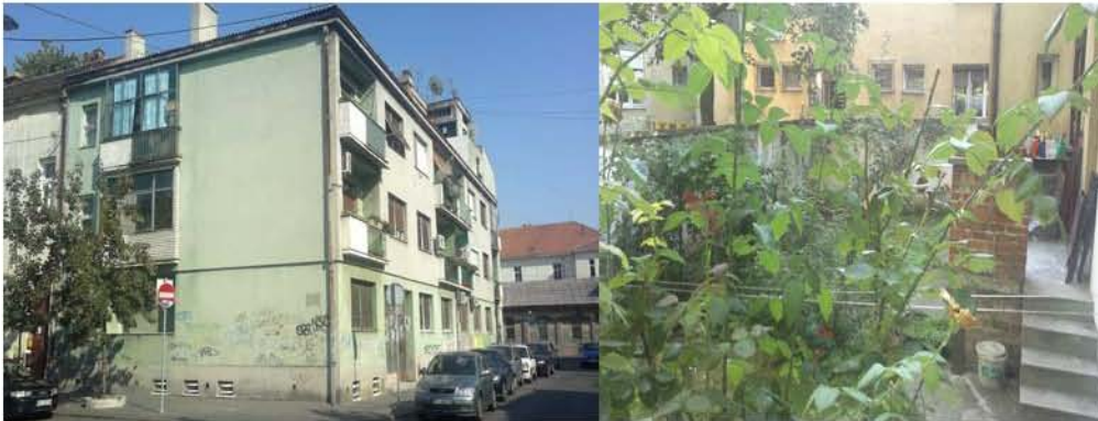
Plac na kojem je nekad bila sefardska sinagoga 2012

Zemunska sefardska sinagoga je oštećena u savezničkom bombardovanju (1944), ali do kraja rata nije pretrpela dalja oštećenja (Dabižić 1999). Komisija komunalnog odseka NO Zemuna je (1. oktobra 1945) sastavila zapisnik o uviđaju po predmetu njenog rušenja. Zapisnikom je ustanovljeno da je zgrada sačuvana, i samo je deo krovne konstrukcije popustio, da jednog dela krova nema, da su prozori oštećeni, da nedostaje stakla, a fasada " za oko 5% oljuštena" (Dabižić 1999). Komisija je ipak predožila rušenje i dalje korišćenje preostalog materijala u građevinske svrhe. Sinagoga je srušena u potpunosti (1947) Njena sudbina je zapečaćena rešenjem gradskog veća NO Beograda (br. 16382/56 od 15. februara 1957), kojim su eksproprisani ostaci sinagoge, i parcela (rešenje gradskog veća NO grada Beograda br. 16382/56 od 15.2.1957). Početkom šezdesetih je na tom mestu nastao stambeni blok, na adresi u Dubrovačkoj 23. Može se samo nagađati, da li je sinagoga srušena pošto je Aškenazi sinagoga bila udaljena od nje svega 40m. Opština je, u svakom slučaju, više brinula o doseljenicima koji su bili potpora novom društvu i poretku. Sefardska sinagoga koja se nalazila na današnjoj adresi Dubrovačke 23 (Dabižić 1999) i podignuta po projektu Josefa Marksa (1871) je srušena i Zemun je izgubio svoju sinagogu.