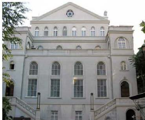
Sinagoga Sukat Šalom 2012