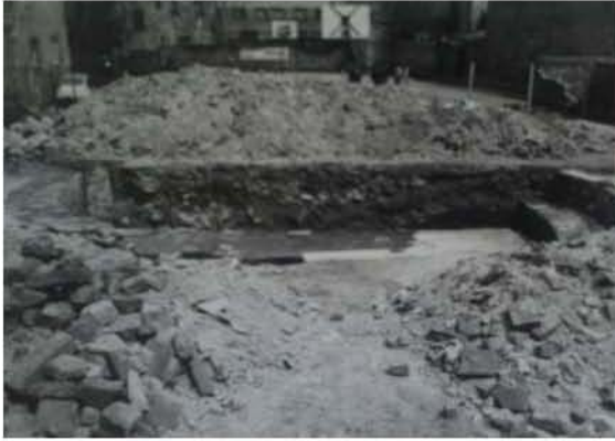
El kal Vjež 1978