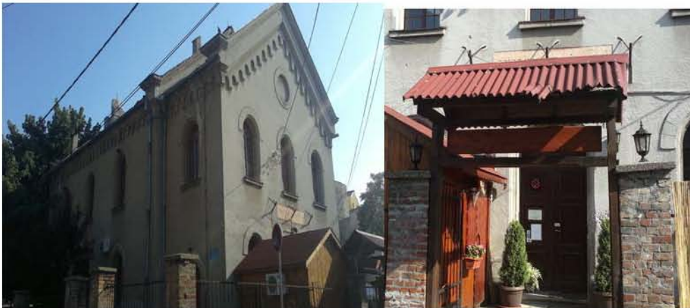
Aškenazi sinagoga 2012