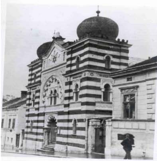
Sinagoga Bet Jisrael pre 1941