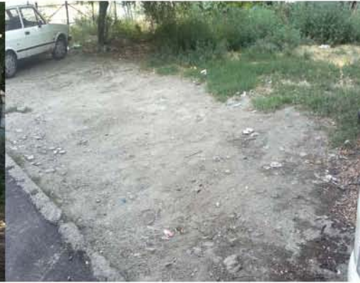
Temelji, južna strana 2012

Slična je sudbina najveće sefardske sinagoge u Beogradu Bet Jisrael . Pošto je oštećena nakon bombardovanja (1941), nacisti su je prilikom povlačenja zapalili (jesen 1944). Unutrašnji delovi građevine, koji su bili od drvene građe, tada su potpuno uništeni. (Nedić 2003). Hram nije obnovljen, mada je to bilo sasvim moguće, naprotiv, jedina beogradska građevina u "mavarskom" stilu je srušena nakon rešenja o eksproprijaciji (rešenje gradske ekproprijacione komisije u Beogradu K.655/49 od 15.11.1949) 6 . Nakon rešenja Drugog opštinskog suda (1963), nepokretnost i parcela na mestu gde se nekad nalazila sinagoga Bet Jisrael vodi se kao "društvena svojina", dok organ upravljanja nepokretnosti postaje tadašnje Ministarstvo za nauku i kulturu. Parcela na kojoj je nastala Galerija fresaka postala je u potpunosti državno vlasništvo. Dopisi koji su se odnosili na građevinske radove i zidanje magacina u okviru Galerije fresaka nigde više nisu pominjali nekadašnjeg vlasnika (IAB SGB, Tehnička dokumentacija 483-5-64, 1964). Isti je slučaj i sa rešenjem i odobrenjem pomenutih radova koje je donela GO Stari grad iste godine (IAB SGB, Tehnička dokumentacija 483-5-64).