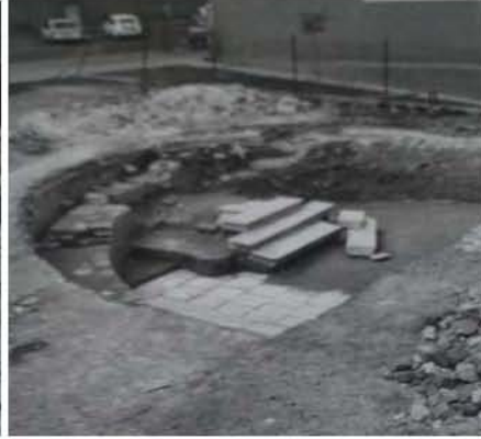
Temelji, južna strana 1978